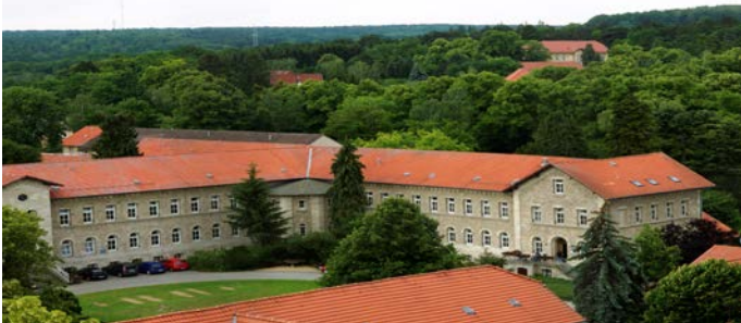
AWO Psychiatriezentrum, Klinik C