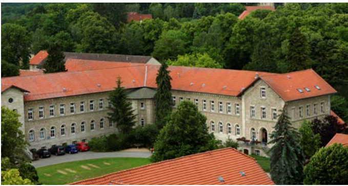
AWO Psychiatriezentrum, Klinik C