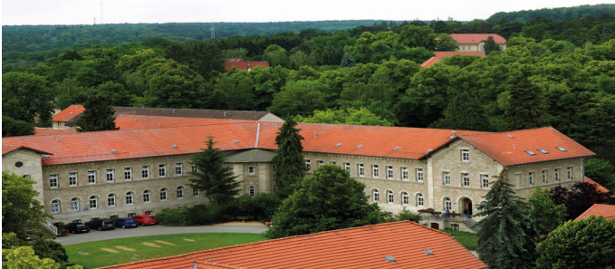
AWO Psychiatriezentrum, Klinik C